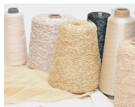
マテリアル事業部

堀田丸正株式会社は創業161年目の繊維専門卸売会社です。 一人ひとりが能力を最大限発揮できる職場環境を目指しています。